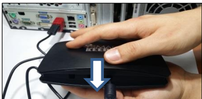
(7) Nach unten drücken