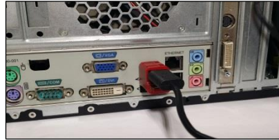
(2) Verriegel den Linklock indem Du den Verschlussknopf drückst