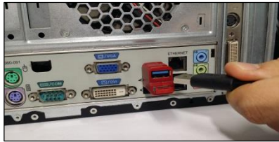
(1) Verbinde den USB Hub mit dem Linklock