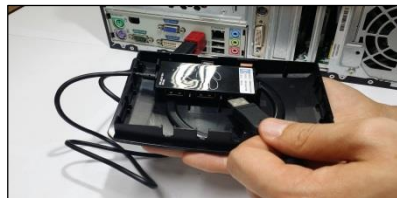
(5) Stecke das USB-Gerät in einen der USB-Ports im HUB