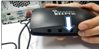
(3) Bewege die Abdeckung in Pfeilrichtung (Siehe Foto)