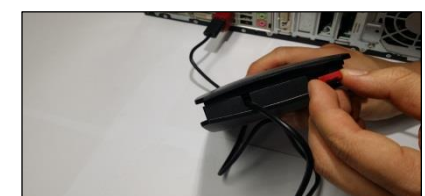
(10) Stecke das Portlock in beide Öffnungen . (Stelle sicher das die Bodenplatte und Abdeckung bündig geschlossen sind)