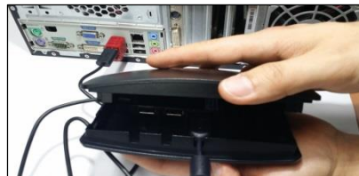
(6) Verbinde beide Komponenten miteinander.