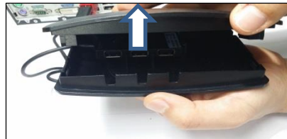
(4) Öffne die Abdeckung indem Du diese anhebst